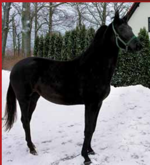
Gala – klacz ocalona przez BPSC